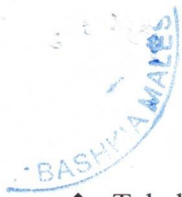
❖ Tabela nr.1 Masa Mujore e shpërblimit për Këshillin Bashkiak dhe Kryepleqtë.